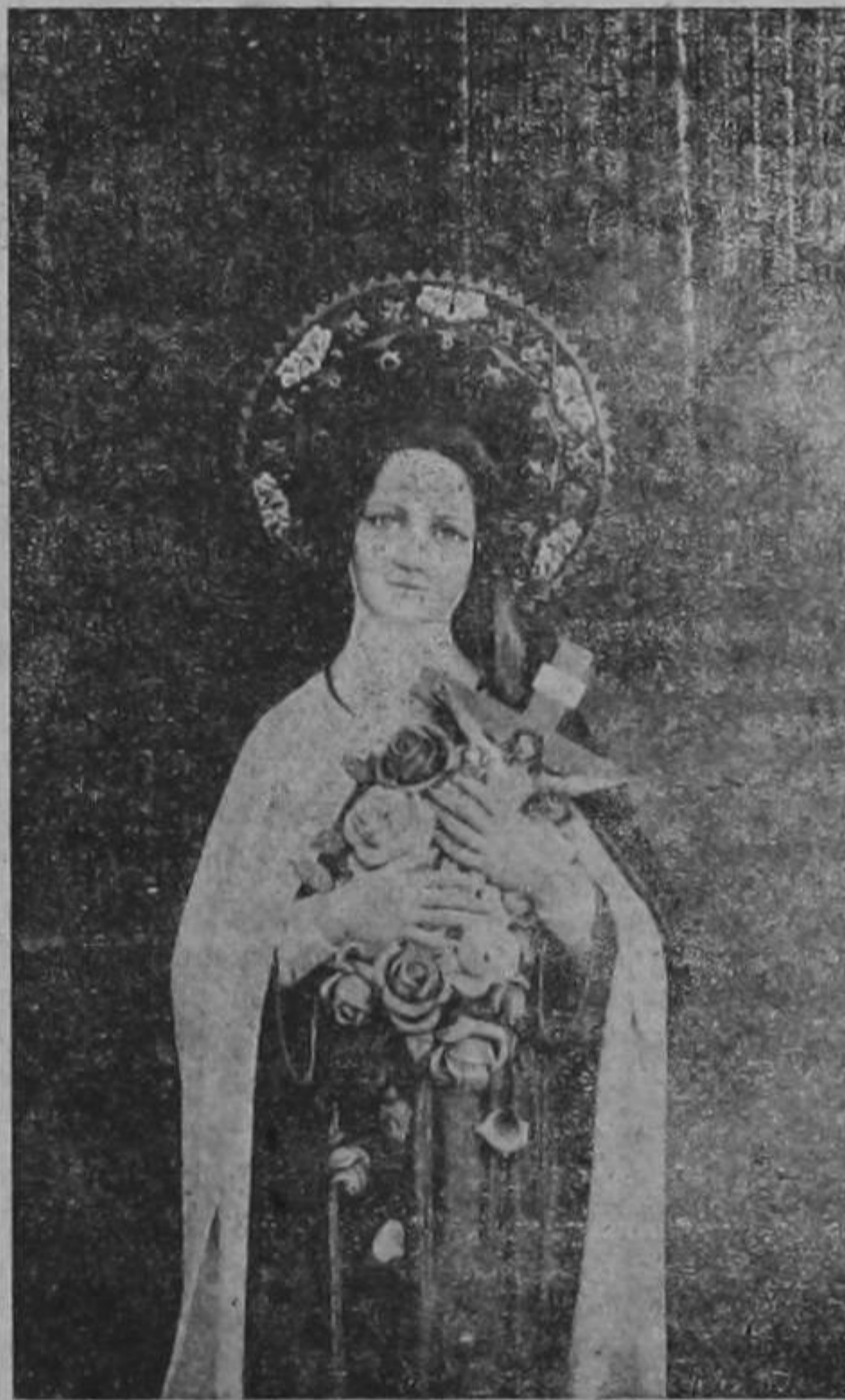
Imagen de Santa Teresita que se venera en la Parroquia de San Pablo de Heredia